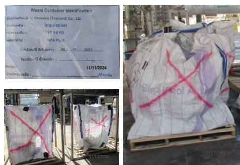
ภาพถ่ายที่ 2.2-14 ภาพขณะบรรจุ บริเวณลานเก็บของเสีย