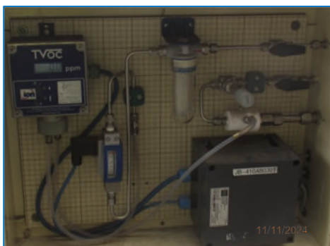
ภาพถ่ายที่ 2.2-7 Phenolic Online Analyzer