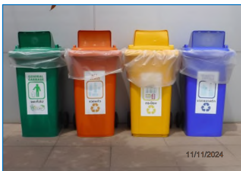
ภาพถ่ายที่ 2.2-13 ถังขยะแยกประเภท