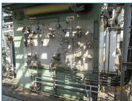
ภาพถ่ายที่ 2.2-3 อุปกรณ์ TOC Online