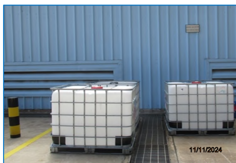
ภาพถ่ายที่ 2.2-15 Scrap Area