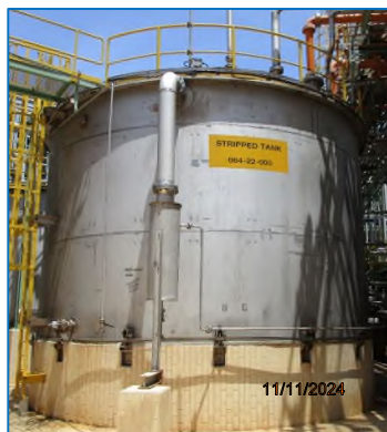
ภาพถ่ายที่ 2.2-9 Stripped Wastewater Tank