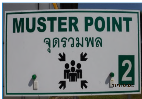
ภาพถ่ายที่ 2.2-25 จุดรวมพลของโครงการ