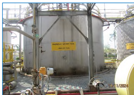
ภาพถ่ายที่ 2.2-4 Phenolic Water Tank