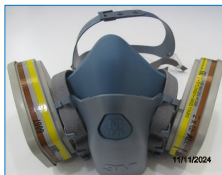
ภาพถ่ายที่ 2.2-20 หน้ากากป้องกันสารเคมีชนิดดัดแปลง