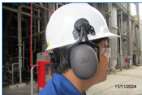
ภาพถ่ายที่ 2.2-2 อุปกรณ์ป้องกันอันตราย ส่วนบุคคล (PPE) สำหรับพนักงานที่สัมผัสกับเสียงดัง