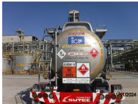
ภาพถ่ายที่ 2.2-18 รถขนส่งวัตถุดิบและสารเคมี