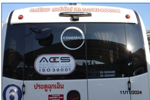
ภาพถ่ายที่ 2.2-19 รถรับส่งพนักงานบริษัท