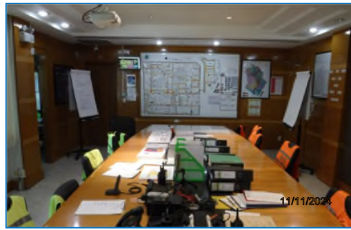
ภาพถ่ายที่ 2.2-24 ศูนย์ปฏิบัติการควบคุมภาวะฉุกเฉิน (ECC)