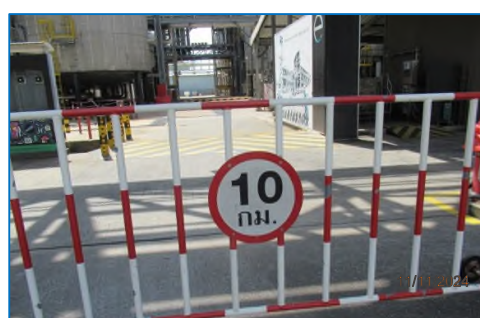
ภาพถ่ายที่ 2.2-16 ป้ายเครื่องหมายจราจรในพื้นที่โครงการ