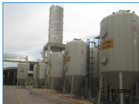
ภาพถ่ายที่ 2.2-10 Activated Carbon Adsorber ของส่วนผลิต PC