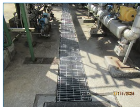
ภาพถ่ายที่ 2.2-12 รังระบายน้ำภายในพื้นที่โครงการ