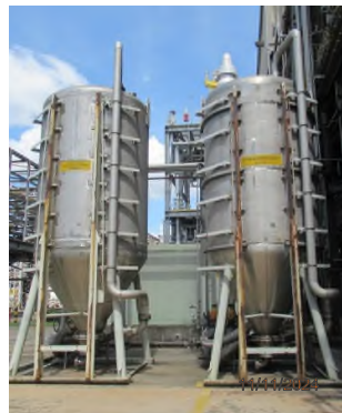
ภาพถ่ายที่ 2.2-6 ระบบดูดซับด้วยถ่านกัมมันต์ ของส่วนผลิต BPA