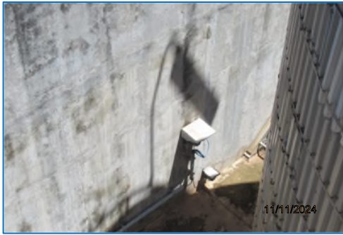
ภาพถ่ายที่ 2.2-23 Gas Detector ที่ถังเก็บ Acetone