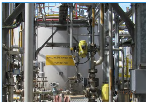
ภาพถ่ายที่ 2.2-5 Final Wastewater Tank