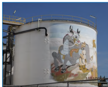
ภาพถ่ายที่ 2.2-8 Hold Tank สำหรับกักเก็บน้ำเสีย