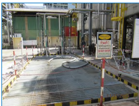
ภาพถ่ายที่ 2.2-11 Process Wastewater Sump