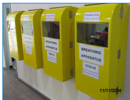
ภาพถ่ายที่ 2.2-22 หน้ากากชนิดถังติดตัวบุคคล (SCBA)