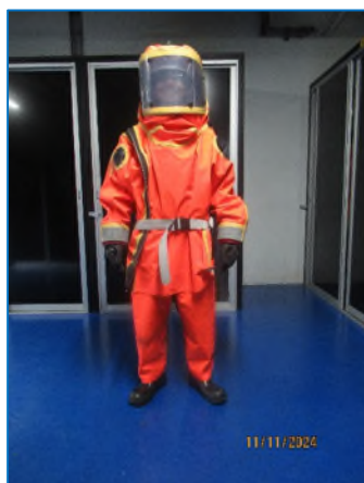
ภาพถ่ายที่ 2.2-21 ชุดป้องกันสารเคมี