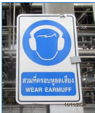
ภาพถ่ายที่ 2.2-1 ป้ายเตือนให้สวมใส่อุปกรณ์ป้องกันเสียงดัง